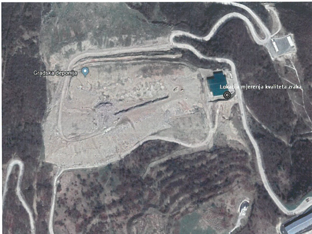
Slika 5.1. Lokacije na kojima se vrše ispitivanja

Na Slici 5.1. prikazani su položaji mjerenog mjesta na kojim se vrše ispitivanja.