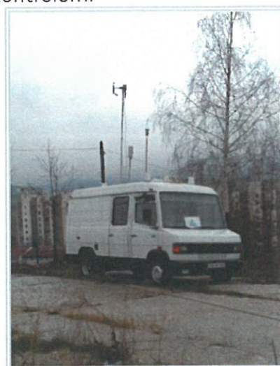
Slika 3.1. Pokretni laboratorij

Sistem vrši automatsku funkcionalnu provjeru za pojedine uređaje, ili se ona vrši ručno, prema potrebi. Svi podaci o funkcionalnoj provjeri, grešci ili drugim nepredviđenim događajima evidentiraju se i pohranjuju u bazu podataka.